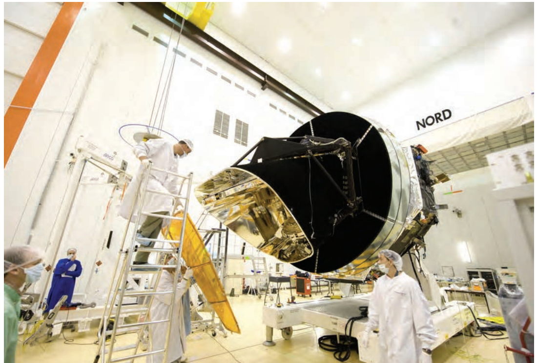
c. Il satellite Planck nel 2009, prima del suo lancio nello spazio.

fenomeno è legato a uno dei concetti più importanti della fisica delle particelle elementari degli ultimi decenni: la scoperta della rottura spontanea di alcune simmetrie. Un esempio fra tutti: la rottura della simmetria elettrodebole, a causa della quale la forza nucleare debole a basse energie si manifesta come interazione a corto range , al contrario della forza elettromagnetica, capace di farsi sentire fino a lunghe distanze. Ebbene, nell'universo primordiale le scale di energia coinvolte sono così elevate, da rimettere in gioco la sottostante simmetria che unifica queste due forze, restituendo a entrambe la capacità di agire a lungo range . Questa transizione, che dalla fase di simmetria restaurata ad alta temperatura porta alla fase di simmetria rotta, avviene quando l'universo è estremamente giovane: circa un decimo di